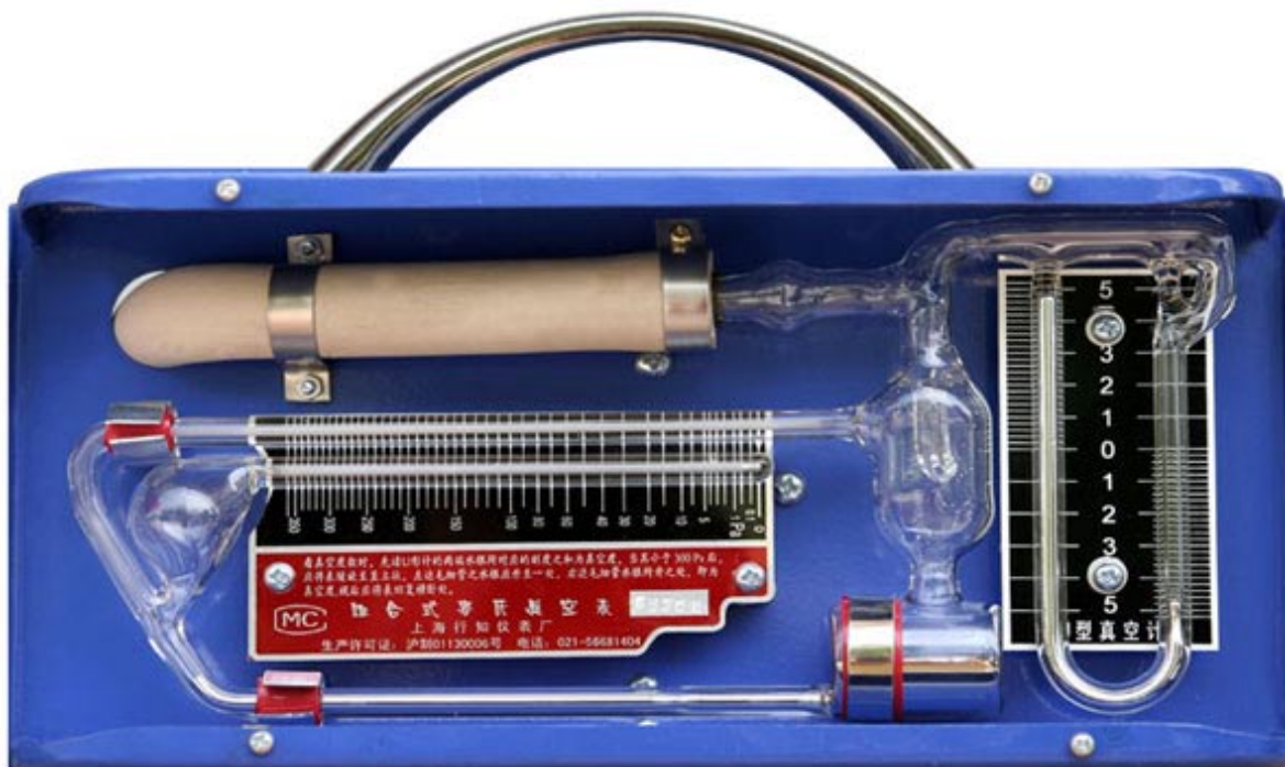
PM-2 组合式麦氏真空表(测量范围 0.1Pa~10kPa)