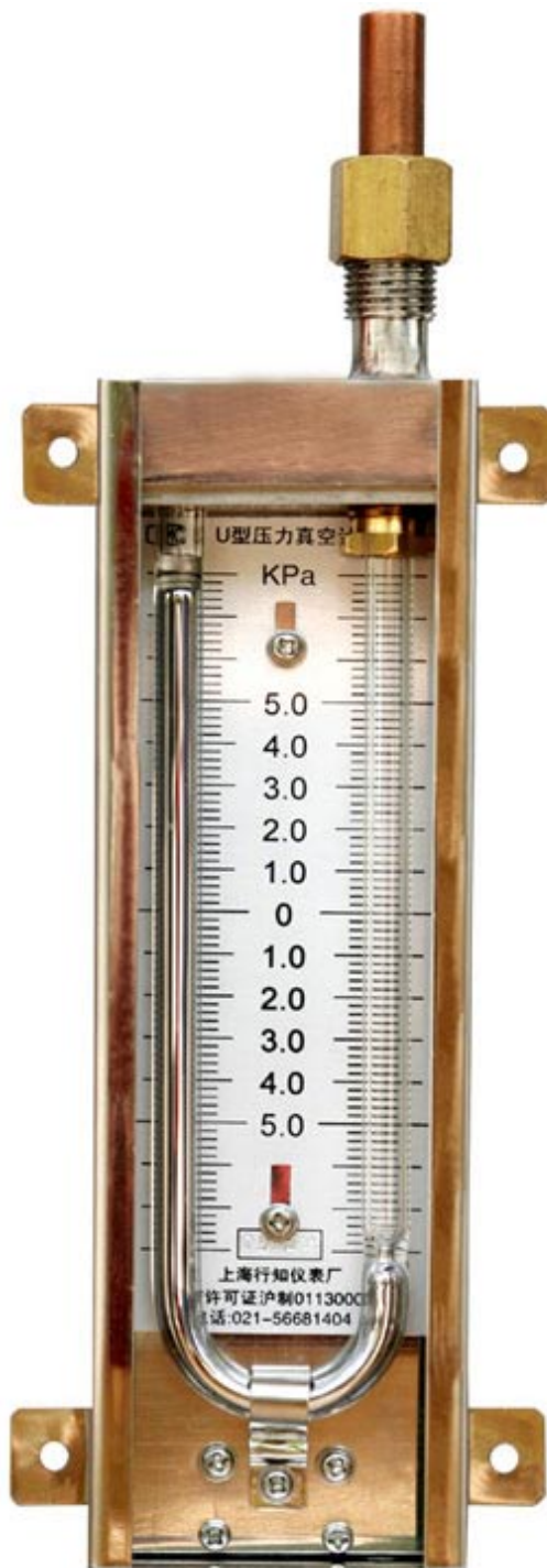
封闭式U型压力真空计（测量范围 0~100mmHg）