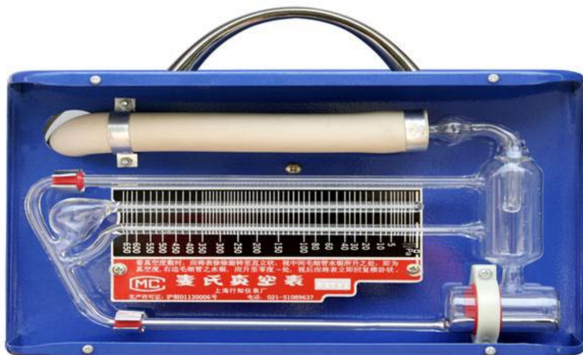
PM-4 流体型麦氏真空表 (测量范围 0.1Pa~650Pa)