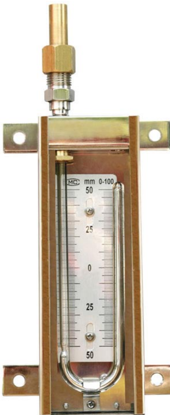
封闭式U型压力真空计（测量范围 0~15kpa）

麦氏真空表又名（转动式压缩真空计）是利用波义耳--马略特理想气体恒温压缩定律研制而成。故测量数值具有“绝对”的意义。由于它可以通过本身的参数，直接算得压强值。所以它除了进行压强测量外，还可以作为绝对真空计用来校验一些相对真空计（如座式压缩真空计就是其中的一种）。PM-2型组合式麦氏真空表，它包含了PM-4型和PM-3型的使用测量范围，分200Pa~10Kpa和0.1Pa~350Pa二阶段进行。PM-4流体型麦氏真空表（测量范围0.1Pa~650Pa）