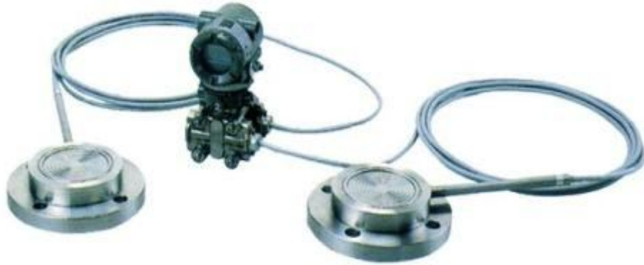
EJA118W、EJA118N 和 EJA118Y