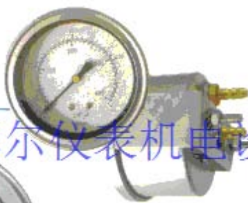
YC-65 低量程、低静压 Low Measuring Range - Low Static Pressure