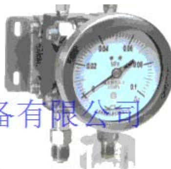
高静压、低量程 High static pressure & Low range