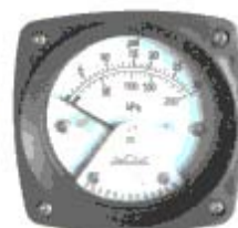
YCC-80 磁感应差压表 Magnetic inductive differential pressure gauge