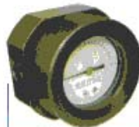
YC-70A 高静压、低量程 High static pressure & Low range